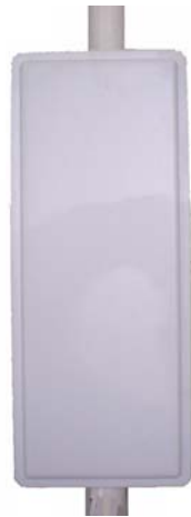
Антенна RFE 3550/60/18

Секторная антенна RFE 3550/60/18 предназначена для построения сетей передачи данных стандарта IEEE 802.11b/g. Используется в составе базового оборудования.