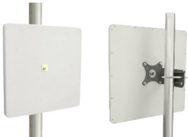
Антенна RFE 5300/25

Панельная антенна RFE5300/25 предназначена для построения сетей передачи данных. Используется в составе базового оборудования.