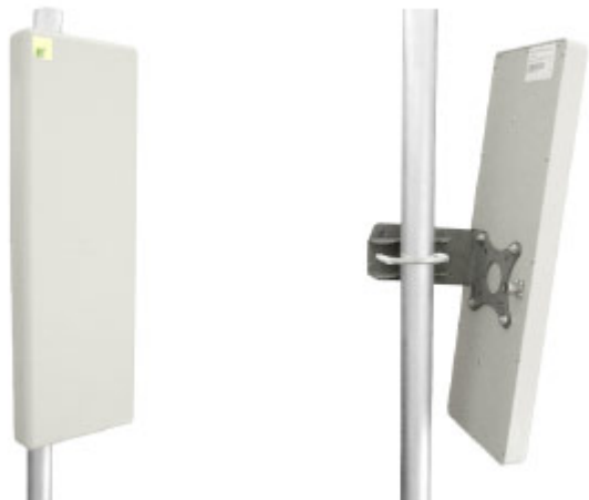
Антенна RFE 5300/60/18H

Секторная антенна RFE 5300/60/18H предназначена для построения сетей передачи данных. Используется в составе базового оборудования.