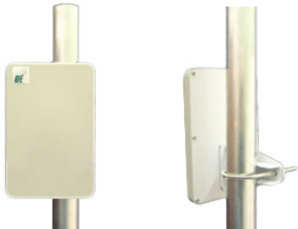
Антенна RFE 6300/14

Панельная антенна RFE 6300/14 предназначена для построения сетей передачи данных. Используется в составе базового оборудования.