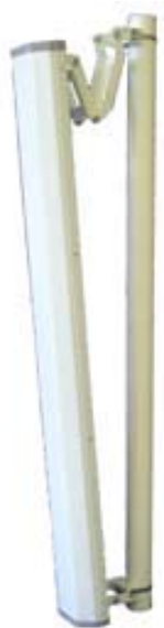
Антенна RFE 2700/60/18H

Секторная антенна RFE 2700/60/18H предназначена для построения сетей передачи данных стандарта IEEE 802.11b/g. Используется в составе базового оборудования.